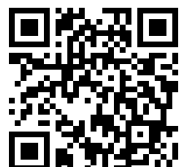
Web申込ページQRコード