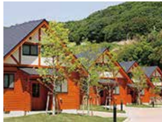
ウェルネスパーク五色オートキャンプ場