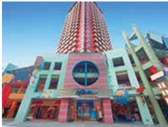
ホテル近鉄ユニバーサル・シティ