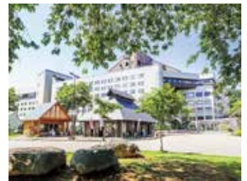
ニュー・グリーンピア津南