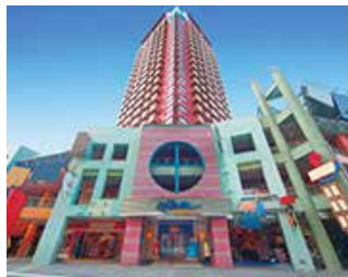
ホテル近鉄ユニバーサル・シティ