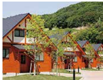
ウェルネスパーク五色オートキャンプ場