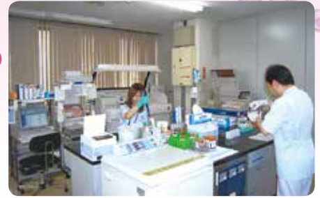
検査室 午前中に受けた検査結果が午後には出ます