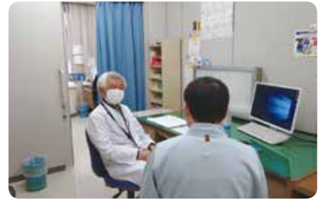
面談室 午後は、検査結果に基づき医師との面談

東実総合健診センターは、多種多項目にわたる検査を短時間で行っており、一般的にはオプション扱いとなっている検査も標準項目として実施し、充実した内容となっています。