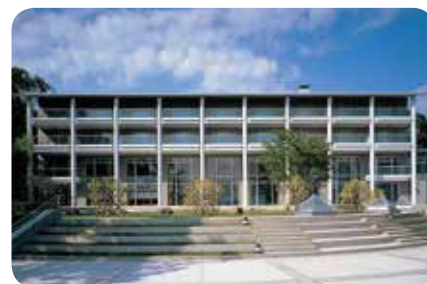
ベルビュー南熱海