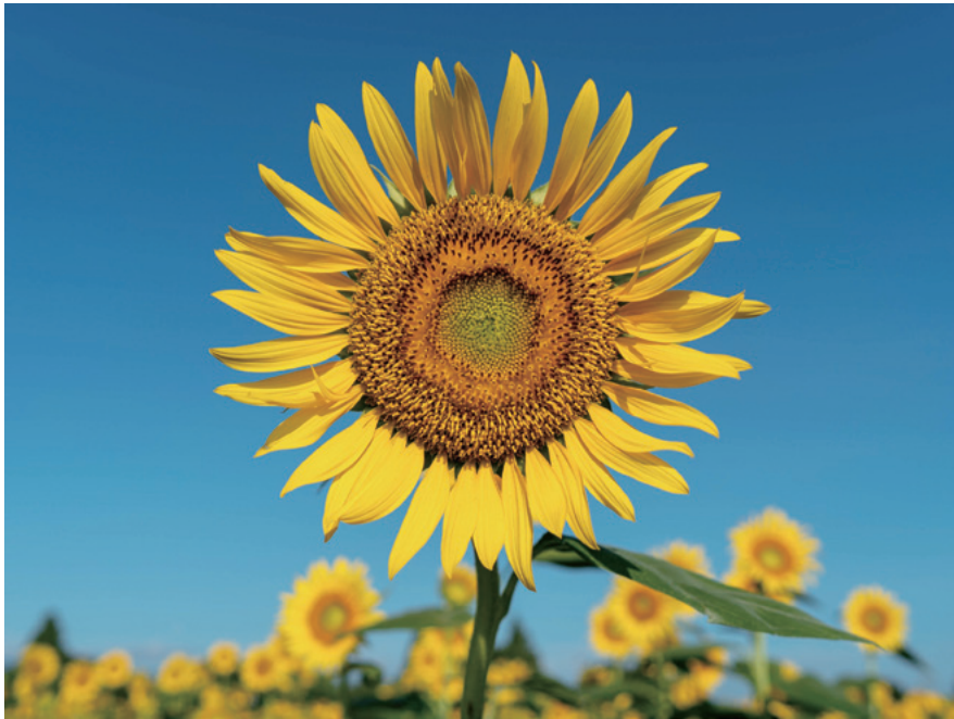
盛夏＝向日葵（神奈川県：座間市）