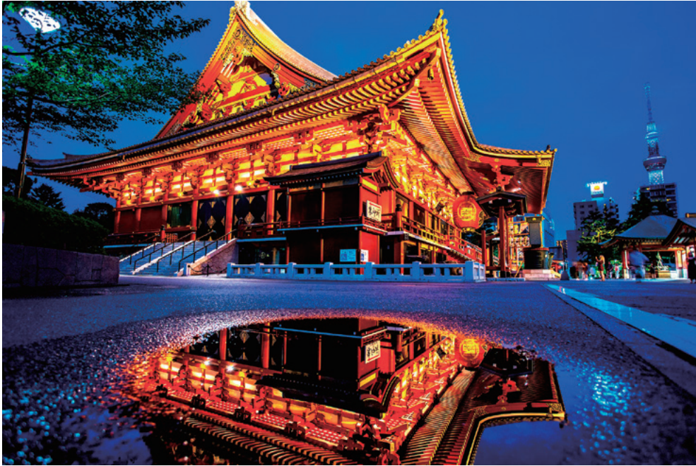
浅草寺リフレクション（東京都台東区：浅草）