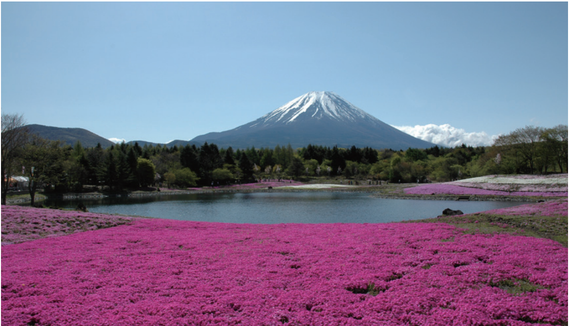
日本の春（山梨県・本栖湖リゾート）